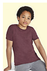
SOL'S REGENT FIT KIDS 01183